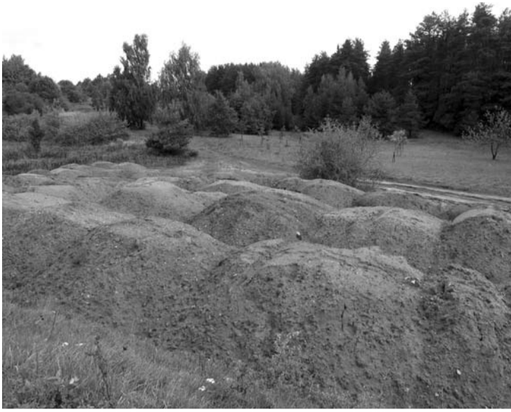
Sutapimas: prie naujojo Anykščių „piliakalnio“ žemės vežamos iš Pilies gatvės.