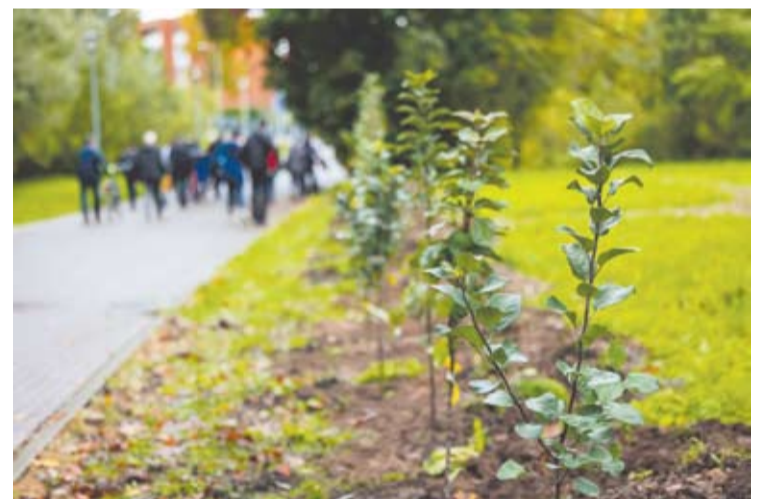
Iš viso „Anykščių vynas“ pasodino daugiau nei pusšimtį obelų.