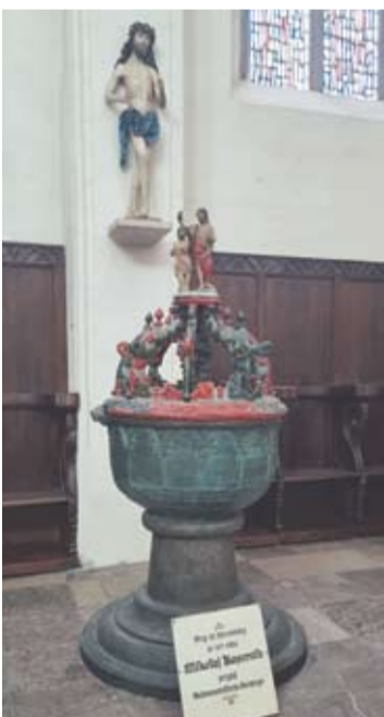
Krikštykla Torūnės katedroje. Čia 1473 metais buvo pakrikštytas astronomas paskelbęs heliocentrinę Saulės sistemos teoriją, teigiančią, kad Žemė sukasi aplink Saulę, Mikalojus Kopernikas.

Teiginys „darbas išlaisvina“ pasitvirtino Oskaro Šindlerio emalės indų fabrike. Vokietis, kilęs nuo Sudetų, O.Šindleris nusipirko bankrutavusį žydų fabriką Krokuvoje ir jame įdarbino vietinius žydus. Pasaulinė