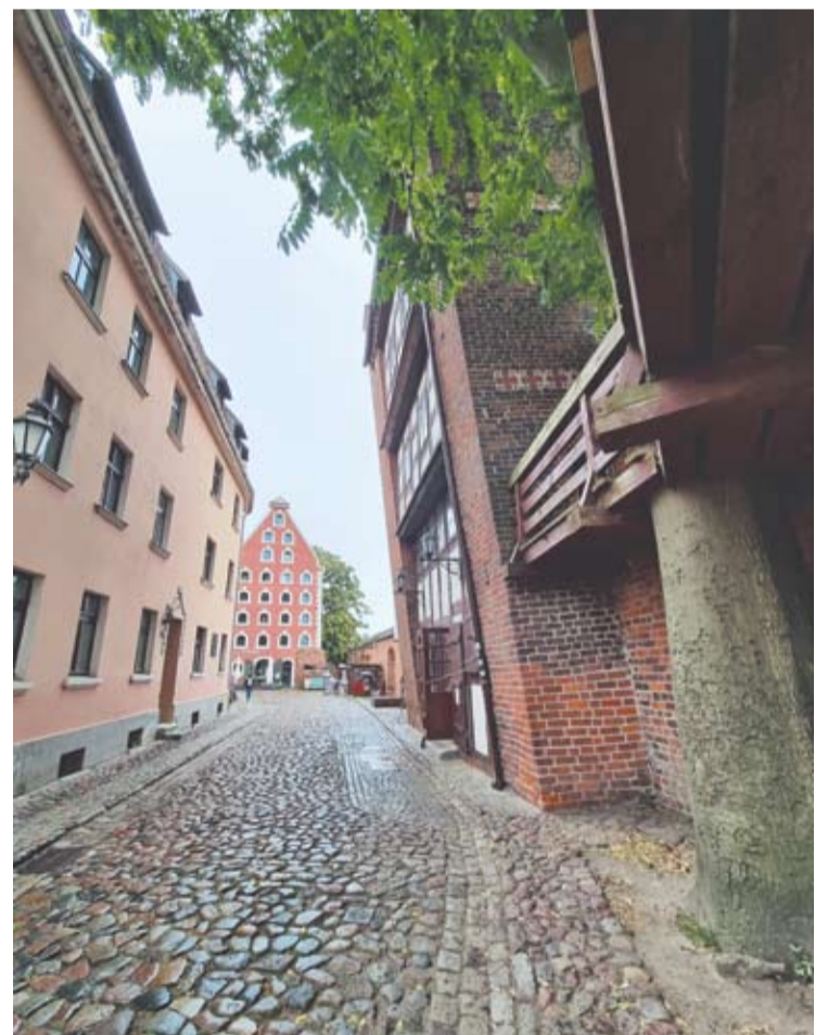
Torūnės gynybinę sieną paremia įaugę medžiai.