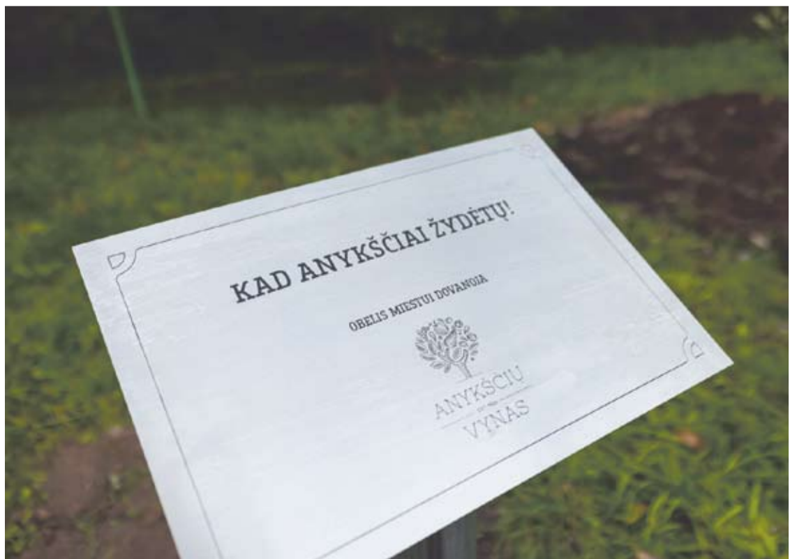
„Anykščių vynas“ obelės pasodino savo 95-ojo gimtadienio proga.