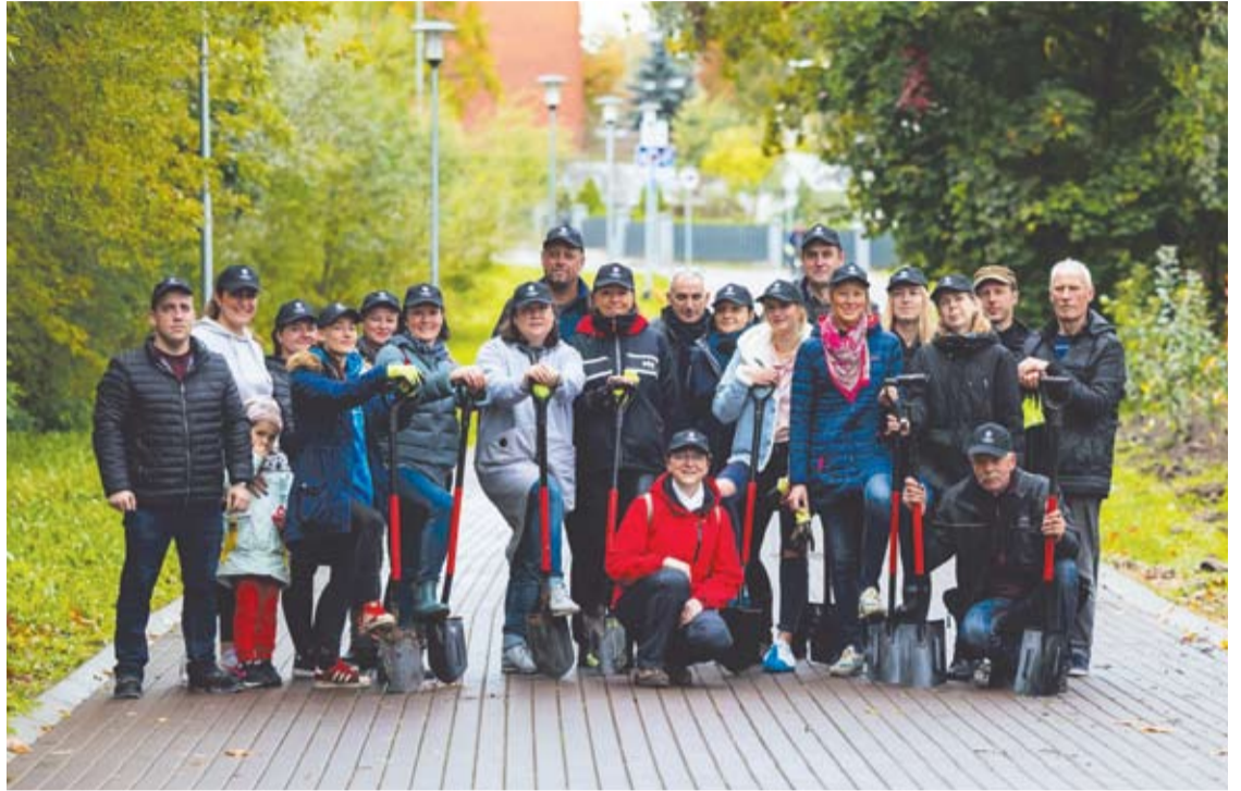
Apdovanoję Anykščius kolegos tryško gera nuotaika.

Meras taip pat atkreipė dėmesį, kad obelės mūsų kultūroje nuo