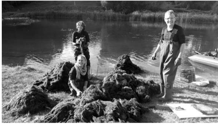
Gamtos tyrimų centro mokslininkai, renkantys ir rūšiuojantys surinktą siūlinių žaliadumблиų biomase. (Ž. Sinkevičiaus nuotr.)

jusios azoto ir fosforo junginių prietakos gausiai vystosi siūliniai žaliadumблиai, kurie yra savotiškas biofiltras šalinant šias maistines medžiagas. Ramesnėse vietose jie gali sudaryti kelių kvadratinį metrų ploto santalkas arba iki 15-30 metrų besidriekiančias kasas. Šios santalkos gerai matomos nuotraukose, padarytose bepiločiais orlaiviais. Susiformavusi perteklinė žaliadumблиų biomase mažina upės rekreacinę vertę, daro ją nepatrauklią poilsiauto-