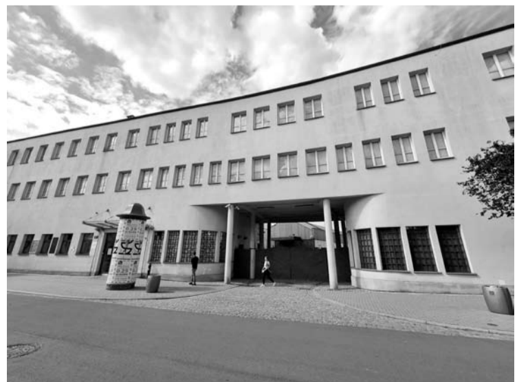
Krokovoje, buvusioje Šindlerio fabrike, apie kuri režisierius Styvenas Spilbergas sukūrė filmą „Šindlerio sąrašas“, dabar veikia muziejus.