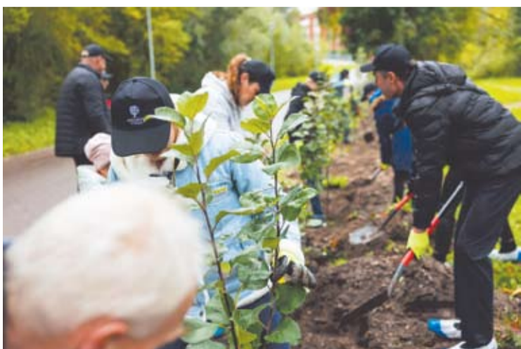
Iš viso obelės sodino apie 20 gamyklos darbuotojų.