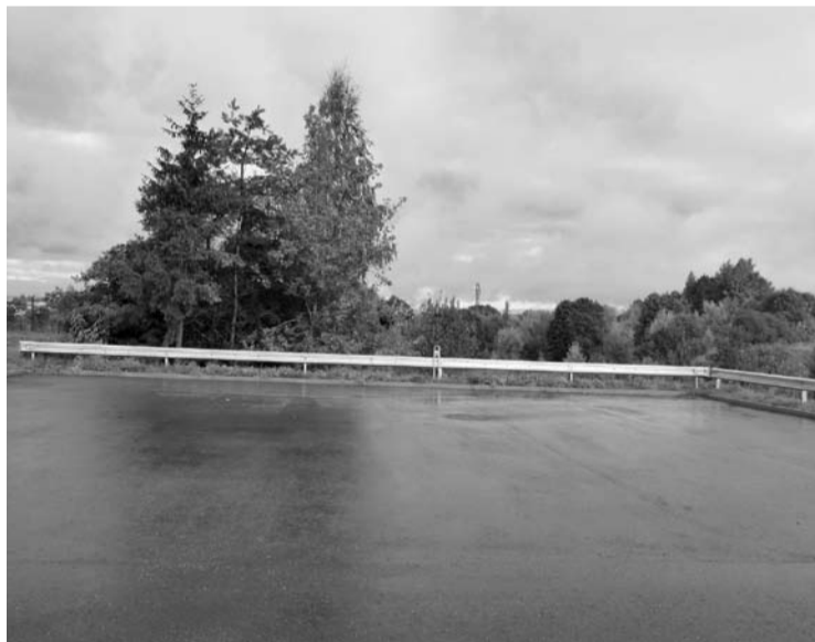
Asfaltuota 20,5 x 19 metrų aikštė Anykščių miesto Šaltupio gatvės gale įrengta pernai.

Vicemeras tvirtino, kad UAB „Melingos“ keliai Šaltupio gatvės projektą atliko taip, kaip buvo nurodyta projektinėje medžiagoje. „Negali jų kaltinti. Buvo projektas, buvo ekspertizė“, – tikino Anykščių rajono mero pavaduotojas.