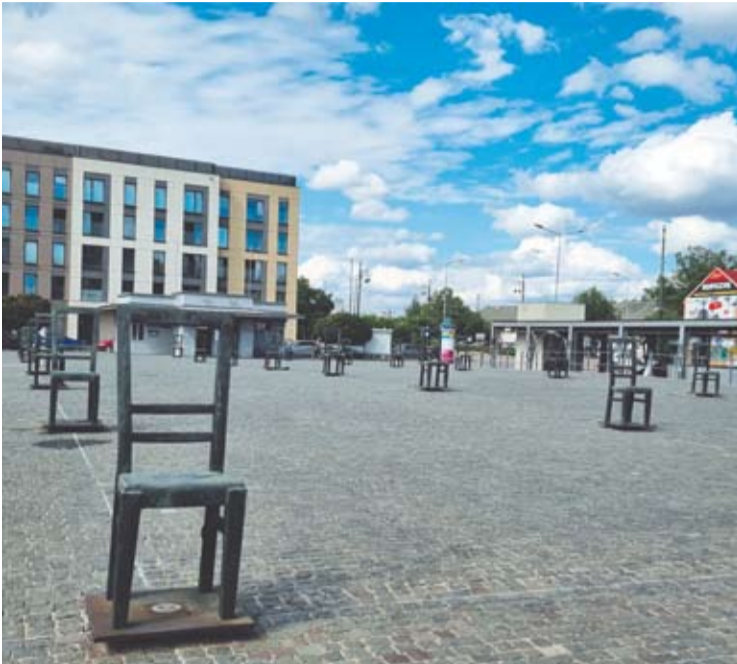
Krokuvos geto vietoje, Herojų aikštėje, pastatytos metalinės kėdės - memorialinė kompozicija, skirta per karą nužudytiems Krokuvos žydams atminti. Gidas pasakoja, kad šis simbolis pasirinktas todėl, kad į getą eidami žydai nešėsi kėdes.