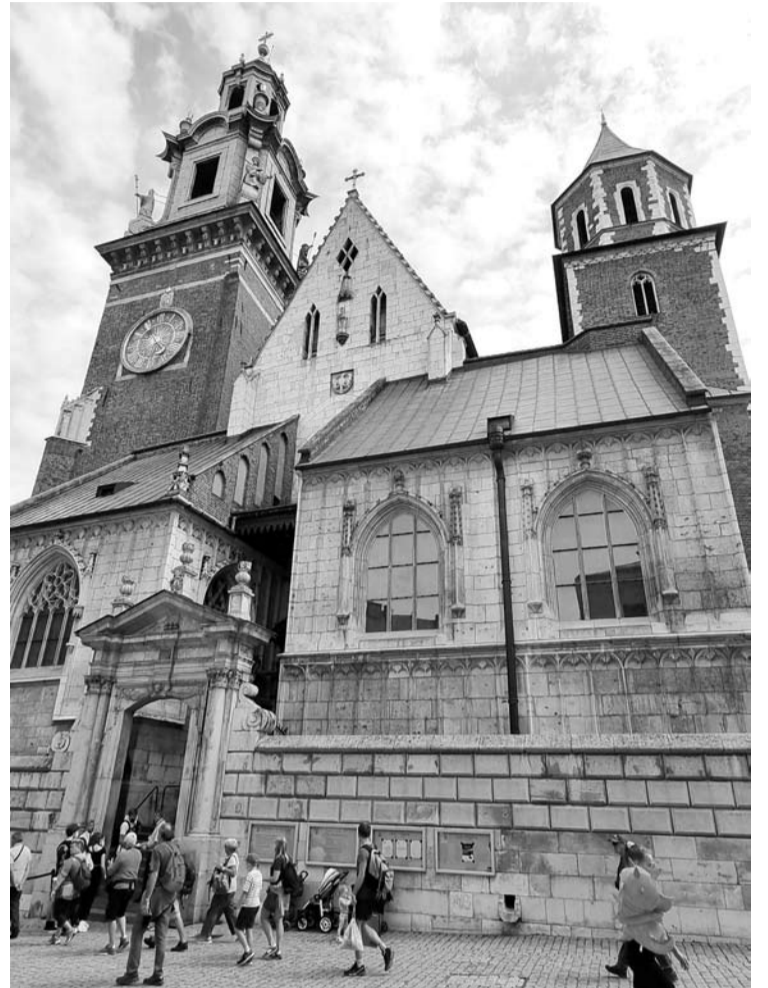
Vavelio katedroje nuo XIV amžiaus laidoti Lenkijos karaliai ir Lietuvos didieji kunigaikščiai. Čia ilsisi Jogaila, jo žmona Jadvyga, Žygimantas Senasis, Žygimanas Augustas ir Ona Jogailaitė. Vavelio katedroje palaidoti poetai Adomas Mickevičius ir Julijus Slovackis, iš Zalavo kaimo (Švenčionių raj.) kilęs maršalas Josefus Pilsudskis. Atisį čia rado ir 2010 metais lėktuvo katastrofoje prie Smolensko žuvęs Lechas Kačinskis. Vavelio katedrai anksčiau vadovavo arkivyskupas Karolis Vojtyla, vėliau tapęs popiežiumi Jonu Pauliumi II.

Krokovoje, prie šventojo Stanislovo bažnyčios, kurios kriptoje palaidotas Česlovas Milošas, turistų lūkuriavo elektriniai traukinukai. Vieno iš vairuotojų paklausėme, kiek kainuotų ekskursija po miestą. Pradėjome derybas nuo 400