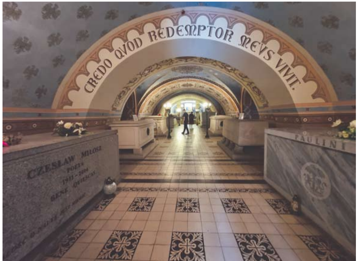
Krokuvos Šv.Stanislovo bažnyčios Nusipelnusiųjų kriptoje ilsisi Šetėniuose (Kėdainių raj.) gimęs Nobelio premijos laureatas, poetas, rašytojas Česlovas Milošas, rašytojas, istorikas Jozefas Kraševskis, istorikas Janas Dlužošas, rašytojas, knygos „Senovės Lietuva“ autorius Aleksandras Briukneris ir kiti. Lotyniškas užrašas virš kriptos skelbia: „Tikiu, kad mano atpirkėjas gyvena.“

Na, o centrinėje Baltstogės aikštėje rugpjūtį buvo išrikiuota dešimtys lauko kavinių. Šeštadienio vakarą jose buvo šimtai žmonių. Kauno dydžio, bet mentališkai labiau Panevėžį primenantį Baltstogė oriai vakarojo. Tiesa, kitaip nei Panevėžyje, Baltstogės kavinėse nesigirdėjo riksmų ir garsaus žvengimo. Dalis kavinių lankytojų - lietuviai, tačiau didžioji masė - vietiniai. Turistams į Baltstogę lyg ir nėra ko važiuoti. Panašu, kad pinigų lenkai turi.