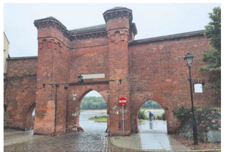
Išlikę Torūnės miesto vartai.