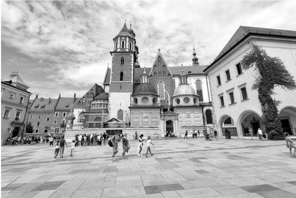
Vavelio pilis - pagrindinis turistų traukos centras Krokovoje.

Lenkija man prasta šalis. Tik už Latviją geresnė. Na, ir už Baltarusiją. Bet tai visiškai subjektyvi ir faktais nepagrįsta nuomonė. Būna, jog su bičiuliais iki nugriuvimo ginčijamės dėl visų skirtingai pamatyto objekto. Kiekvienas individualiai suvokia tai, kas gražu ar negražu. Tai faktas. Tačiau kartais vienam atrodo, jog eilėje prie muziejaus stovėjome valandas, kitam - kad minutes, o trečiam - jog eilės apskritai nebuvo.